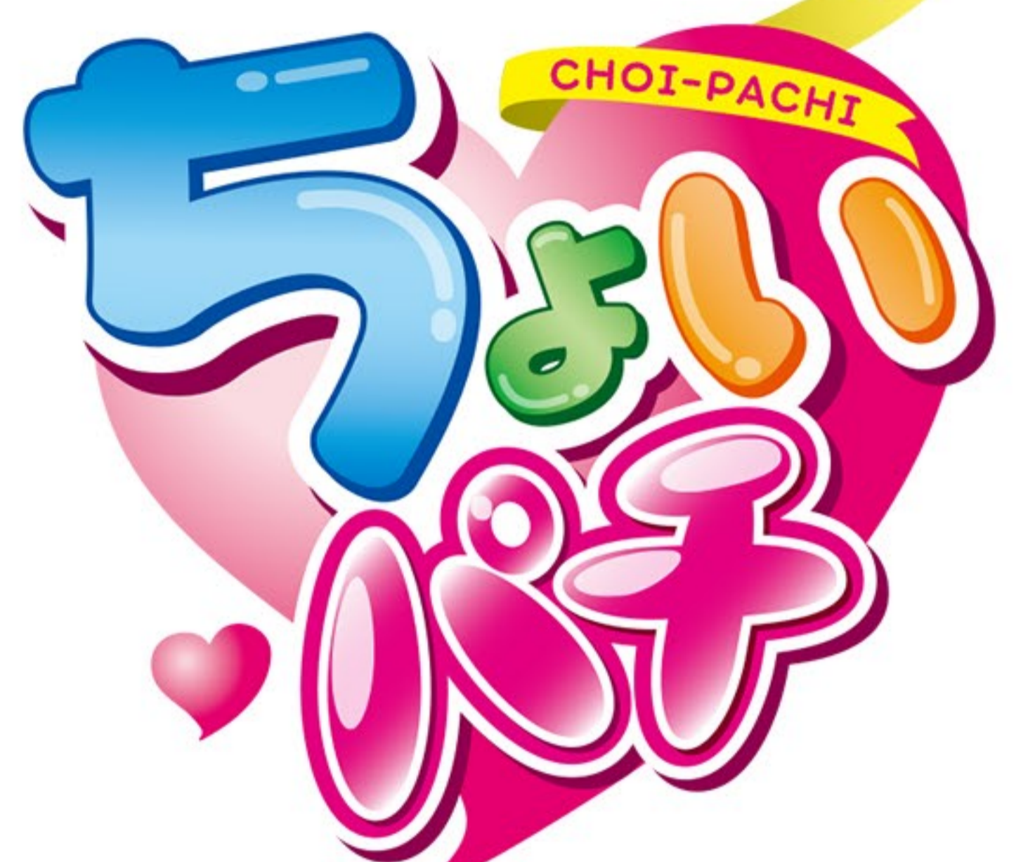
イラスト/ちゅうじょうゆきよし